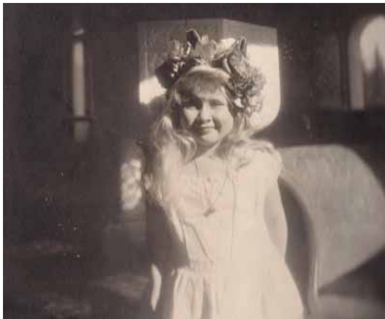
Mignon, fotografie de familie.