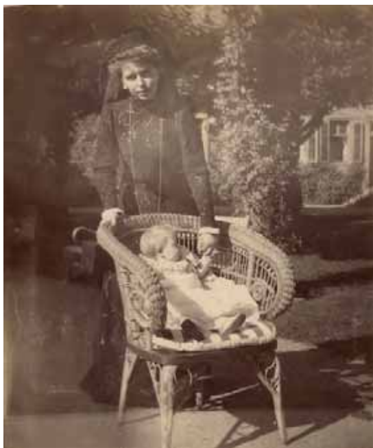
Principesa Maria cu fiica sa la Gotha.

„toată lumea se înclina la frumusețea și farmecul ei” 22 , consemna încântată Missy. Primele fotografii ale lui Mignon sunt cele cu mama ei, apoi cu frații, Carol și Elisabeta, studiourile fotografice din Coburg, Gotha sau București tipărindu-i primele imagini, popularizate prin intermediul presei sau al cărților poștale. Pe 27 iunie 1900, Missy scria mamei sale despre fotografiile trimise. Mai ales una dintre ele era peste măsură de frumoasă.